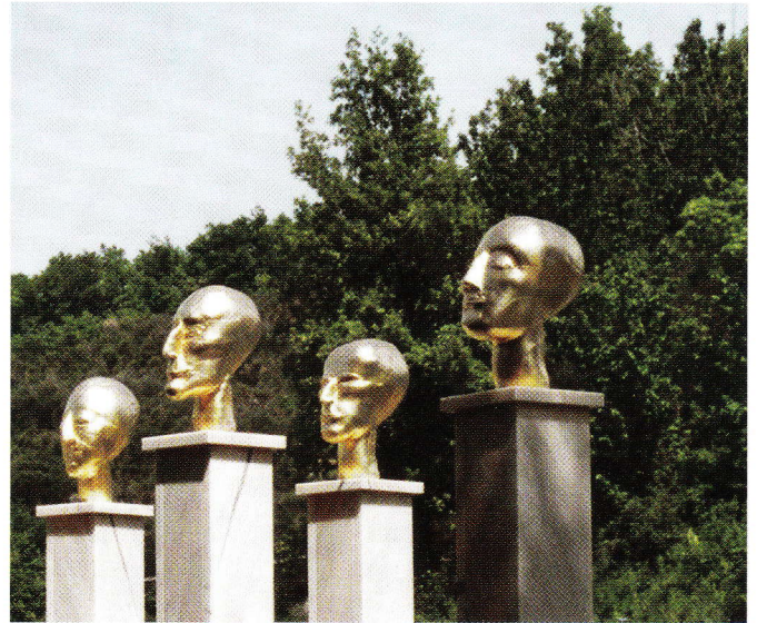
▼ Bannen Spoerris „Chambre No.13“, 1998, Bronze, 2,5 x 3 x 5 m, ein Highlight im Garten und Spoerris früheres Studentenzimmer

dert nach Christus bereits die Römer, die mit der Villa - damals nicht nur ein luxuriöses Haus, sondern eine großzügige Wohnanlage mit Garten - den Grundstein legten für diese Symbiose. Die römische Villa war ein Ort der Muse (otium), diente als Rückzugs- und Fluchtort vor den Geschäften (negotium). Ein Ziel dort war die Vervollkommnung der Natur durch Menschenhand: durch Ingenieure, die beispielsweise Bäche umlegten und Hügel aufschütteten. Und durch Künstler, die Skulpturen schufen, meist dem Schönheitsideal verpflichtet. Dieser Wirklichkeit gewordene Traum vom Ende aller Sorgen wurde Jahrhunderte später wiederbelebt in den Renaissancevillen in Norditalien und dann in den Schlössern des Barock, die sich mit verspielten Parks schmückten - angefangen mit Versailles 1661. Dort plätscherte das Leben.